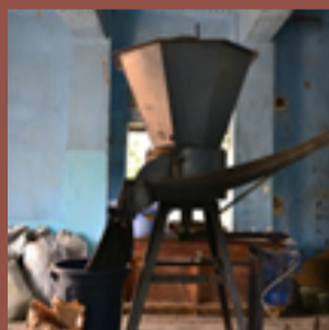
Broyage et liant