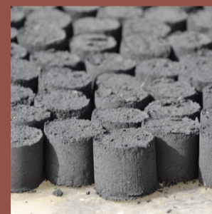
Charbon de Typha