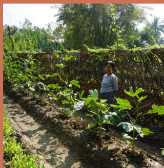
Appui à la transition agroécologique