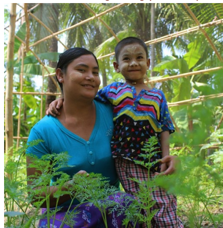
Maraîchère agroécologique dans sa parcelle

EfK, issue d'une ONG locale, offre à la fois un appui technique et organisationnel aux OP offrant des services non financiers, et une collaboration autour de la filière riz sur un modèle économique innovant aux plus structurées d'entre elles.