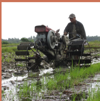
Crédit bail pour l'achat d'équipement