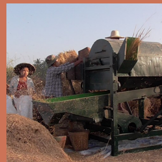
Appui à la production rizicole