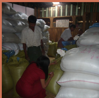
Crédit stockage pour de meilleurs prix du riz