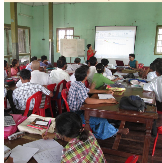
Formation des membres des comités de gestion d'AYAM