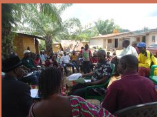
Action de l'Alliance pour la résolution d'un conflit domanial dans la zone des monts Nimba vers Bossou