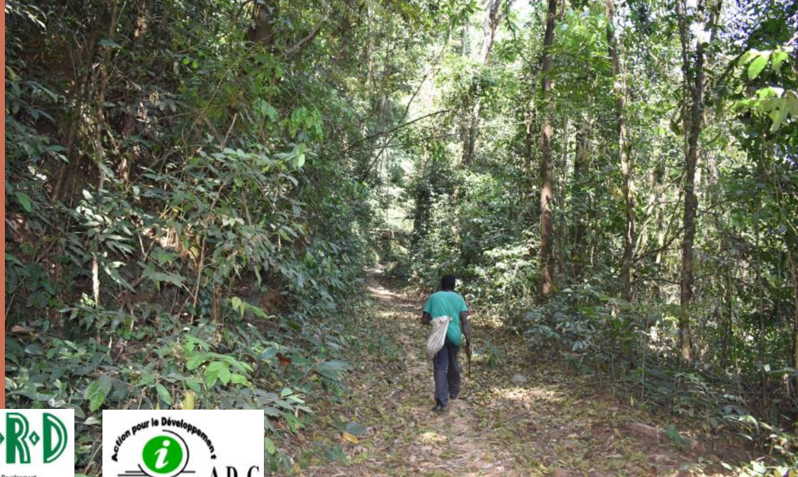
Paysan dans la forêt classée Ziama vers Sérédou