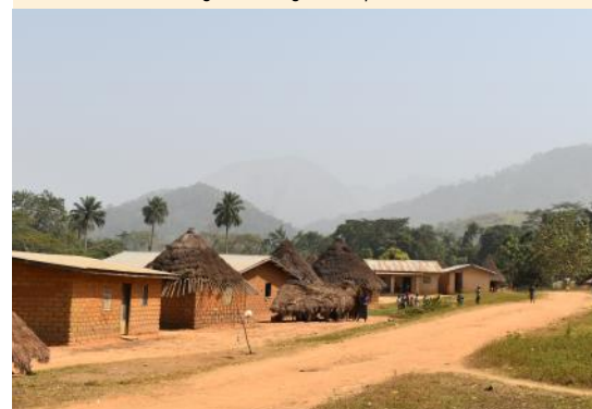
Village de Seringbara au pied des Monts Nimba