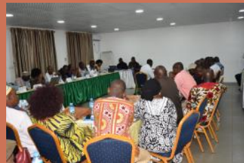
Réunion de la Coalition pour la protection du patrimoine génétique africain, organisée à Conakry par Acord-Guinée