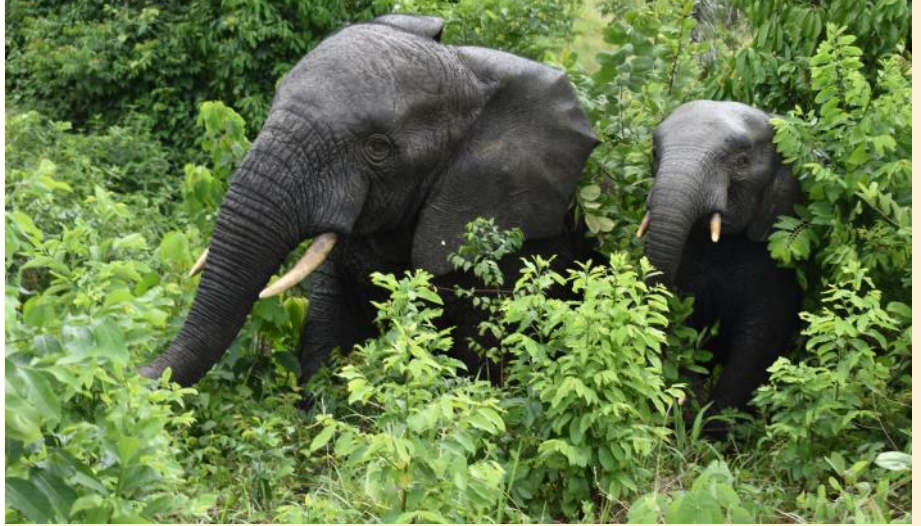
Éléphants de la forêt classée de Ziama à Macenta