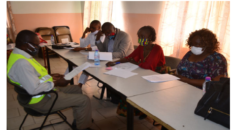
Focus group de l'atelier d'échanges d'expériences sur l'accueil, l'écoute et l'orientation des publics en situation de vulnérabilité