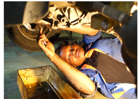
Mise en situation d'une apprentie en mécanique automobile pour la réalisation des contenus dématérialisés