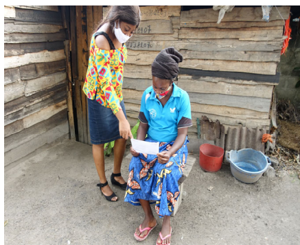
Validation des candidatures des jeunes en situation de vulnérabilité lors des enquêtes de terrain