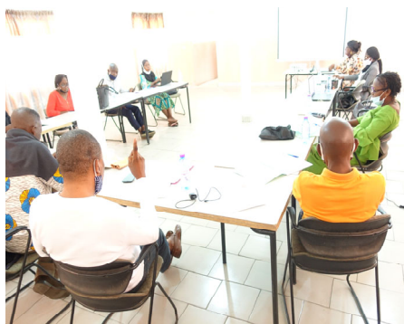
Séance de travail du GTi pour la validation des compétences-produits avec les professionnels des métiers

Le Groupe de Travail insertion (GTi) co-construit les stratégies et les outils pour la mise en œuvre et le suivi du projet. Il est composé des représentants des centres de formation, de la CAS et de la DDAS et des différentes OSC prenant part au projet.