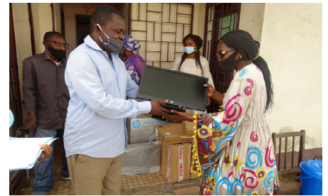
Remise des équipements informatiques à la CAS

La CAS a par ailleurs été équipée en matériel informatique après que ses agents sociaux aient reçu une formation pratique sur l'utilisation des outils numériques. Sa base de données a été numérisée pour un meilleur suivi des publics accompagnés.