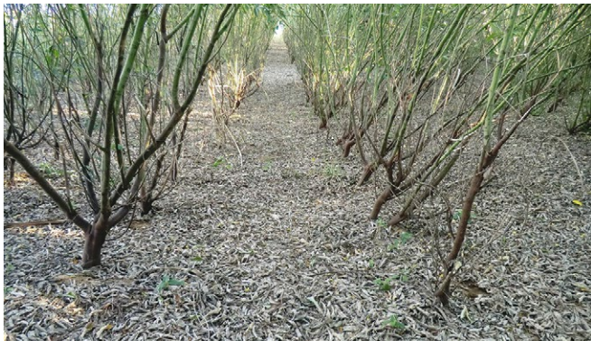
Restauration des terres dégradées par l'installation d'une mini-forêt de pois d'Angole, Androy, Madagascar