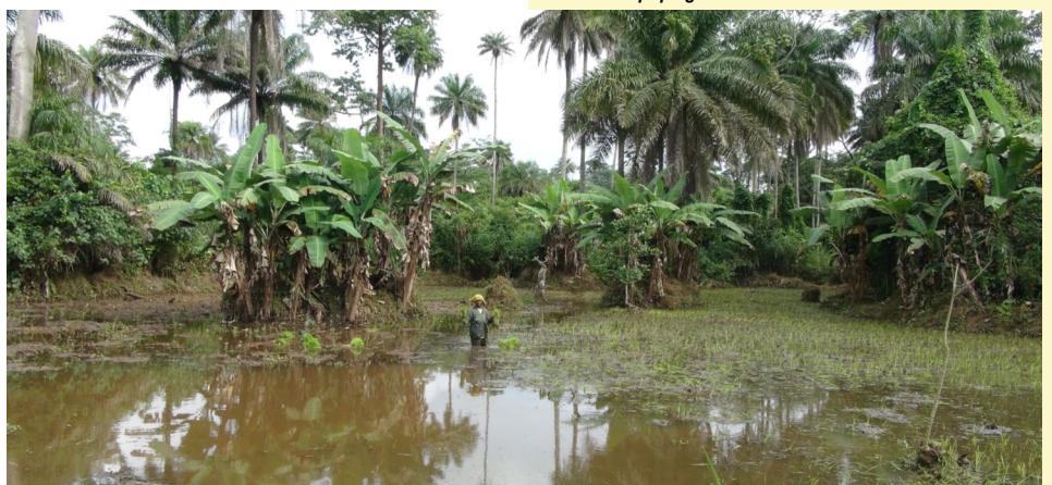
Repiquage de riz de bas-fonds en Guinée forestière