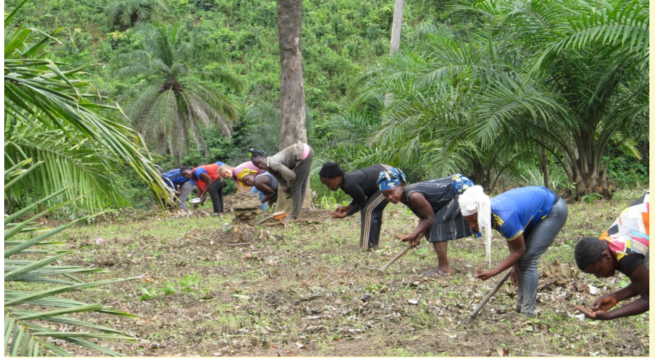
Semis de Pueraria dans une jeune palmeraie en Guinée forestière