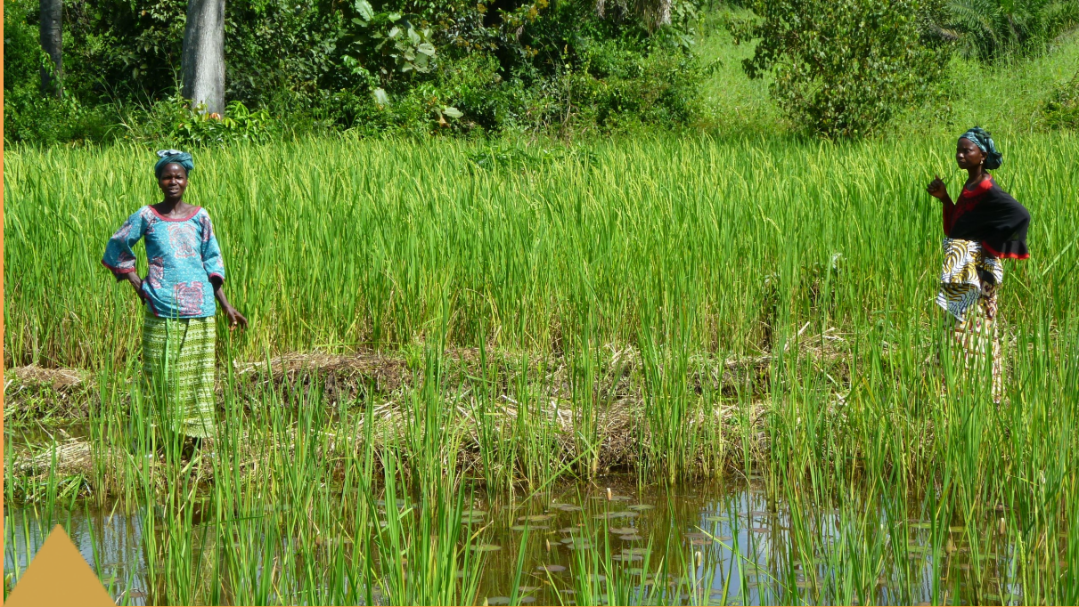
Productrices de riz de bas-fonds en Guinée forestière